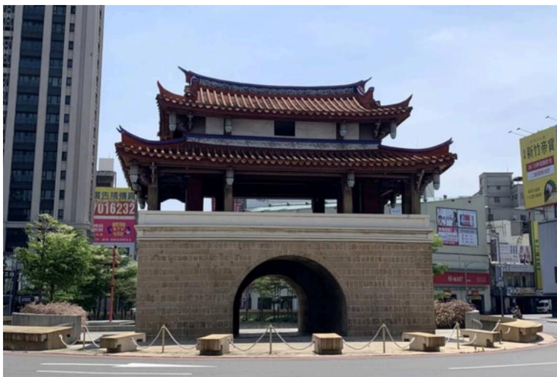
上圖：新竹東門城（迎曦門）