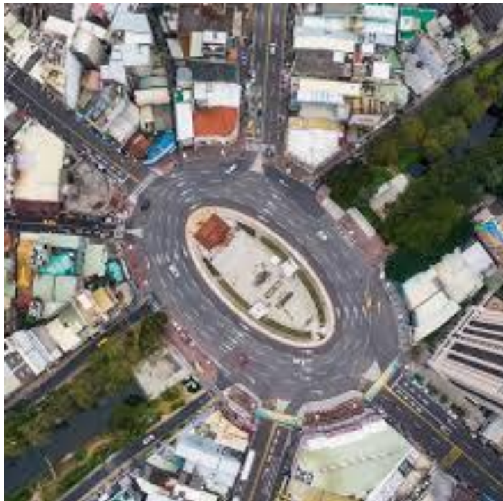
上圖為：圓環周邊動線

社區參與與教育推廣： 鼓勵學校和社區組織參與迎曦門的維護與活動策劃，深化市民對古蹟的認識與情感連結。